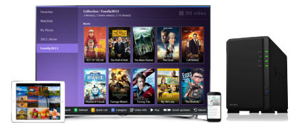
Biblioteca multimedia Ultra HD 4K

Synology DS218play presenta un diseño de gran eficiencia energética. En comparación con sus equipos homólogos medios, Synology DS218play+ consume la relativamente baja cantidad de 16,79 vatios durante el acceso y 5,16 vatios cuando se activa la hibernación del disco duro. La función de encendido/apagado programado reduce aún más el consumo de energía y los costes operativos a largo plazo.